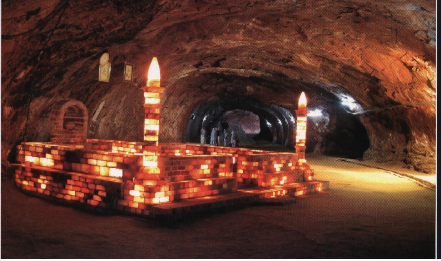
Khewra Salt Mines 3

ح ہو جاتی ہے۔ لوہے کے اوزاروں کو زنگ آلود ہونے سے بچانے کے لئے لیموں کے رس میں نمک ملا کر دھوپ میں رکھنے سے زنگ دور ہو جاتا ہے۔ سیاہ نمک کے استعمال سے دل کو فائدہ ہوتا ہے اور منی میں اضافہ ہوتا ہے۔ بھوک زیادہ ہوتی ہے اور قبض سے نجات ملتی ہے۔ سیاہ نمک دست آور اور ہاضم ہے۔ 1 پاکستان دنیا بھر میں معدنی نمک کے ذخائر رکھنے والا دوسرا ملک ہے۔ پاکستانی کھیوڑہ میں پایاجانے والا قیمتی پہاڑی نمک کیمیائی اور طبی خواص رکھتا ہے۔ ماہرین کی تحقیقی کے مطابق گلابی نمک میں 84 نمکیات اور منرلز پائے جاتے ہیں جو انسانی صحت اور نفسیات کے لیے فوائد سے بھرپور ہیں۔ ان 84 منرلز میں آرسینک، مرکری، یورینیم اور پلائٹنیم جیسی قیمتی دھاتیں بھی نمک کا خاصہ ہیں۔ پاکستانی کان سے نکلنے والا معدنی و کیمیائی خواص والا پانی ہے جسے "برازن سلوشن" کہا جاتا ہے۔ 2